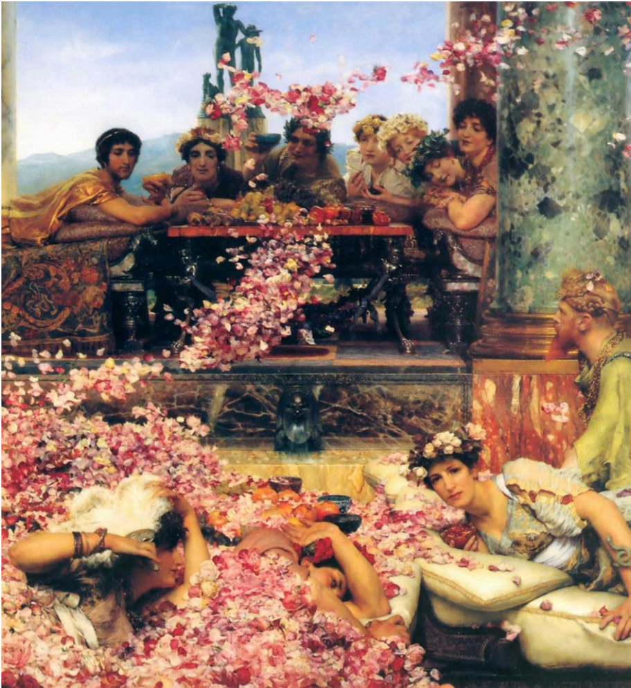
Ausschnitt aus The Roses of Heliogabalus , Sir Lawrence Alma-Tadema, 1888